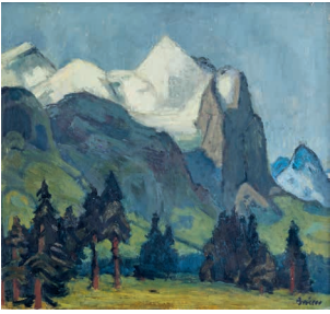
Arnold Brügger, 1888–1975 «Das Wetterhorn» Öl auf Leinwand, 65x70 cm